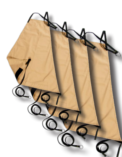
Comfort cp model 5 t/m 15

De accessoire verbinding, voorheen de Porch connector genoemd, is nu beschikbaar voor alle Adventure tipi modellen. 'Basis light' is beschikbaar voor model 7 en 9. 'Comfort light' is beschikbaar voor model 2 t/m 9. 'Comfort katoen/polyester' is beschikbaar voor model 5 t/m 15.