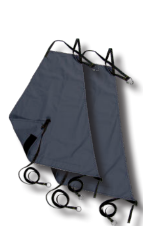
Base light model 7 en 9